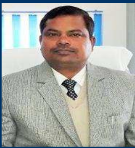
श्री जागेश्वर प्राचार्य केन्द्रीय विद्यालय सुबाथु